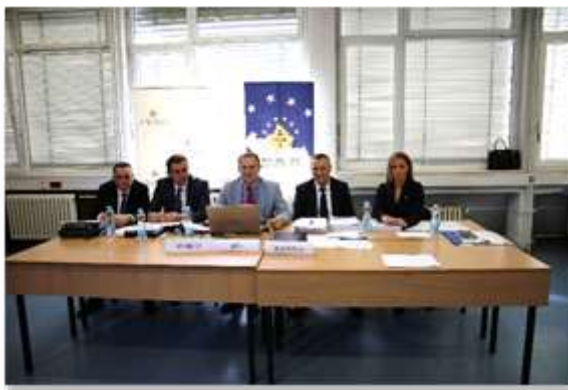
Komisioni gjatë hartimit të testit kualifikues

Përkthimi në gjuhën serbe i testit të hartuar është bërë nga përkthyesit e KPK-së dhe në prezencën e Komisionit për Rekrutim.