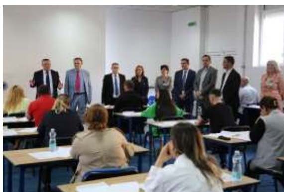
Njëra nga sallat e mbajtjes së Testit Kualifikues

Regjistrimi i kandidatëve për t'iu nënshtruar Testit Kualifikues është bërë nga stafi administrativ i KPK-së në përputhje me Rregulloren. Për shkak të numrit të madh të kandidatëve janë përdorur 16 klasa dhe tri salla.