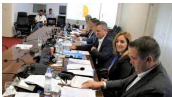
Komisioni për Rekrutim gjatë mbajtjes së intervistave si dhe monitoruesit ndërkombëtar