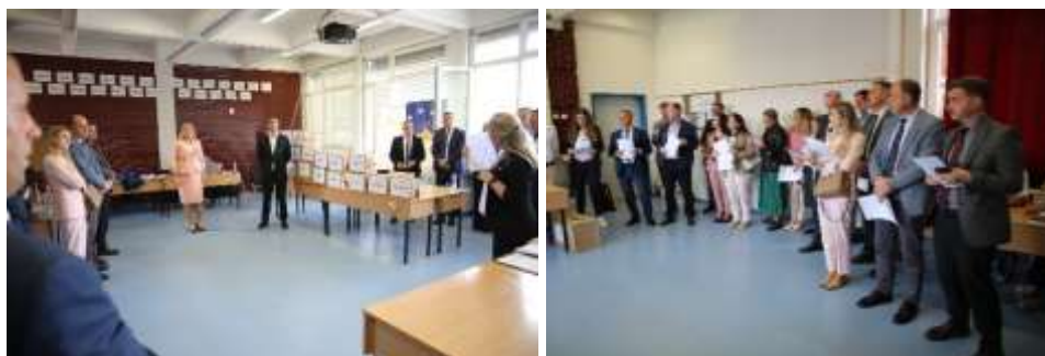
Ndarja e detyrave mbikqyrëse të sallave

Procesi i fotokopjimit është kryer nga stafi mbështetës në ndërtesën e Akademisë së Kosovës për Siguri Publike, në prani të Komisionit për Rekrutim dhe të monitoruesve ndërkombëtar.