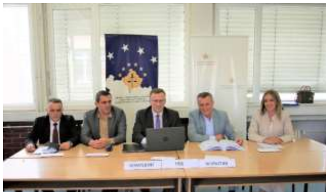
Hartimi i Testit me Shkrim

Regjistrimi i kandidatëve për t'iu nënshtruar Testit me Shkrim është bërë nga stafi administrativ i KPK-së, në përputhje me Rregulloren. Për shkak të numrit të madh të kandidatëve janë përdorur gjashtëmbëdhjetë (16) klasa.