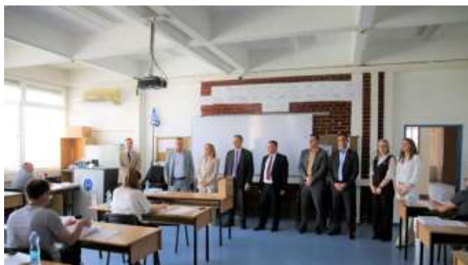
Komisioni për Rekrutim gjatë mbikëqyrjes së Testit me Shkrim

Testit iu nënshtruan dyqindetëtdhjetenjë (281) kandidatë, pasi që katërmëdhjetë (14) ishin tërhequr në ndërkohë. Të gjithë kandidatëve iu siguroa nga një përmbledhje e ligjeve penale (materiale dhe procedurale).