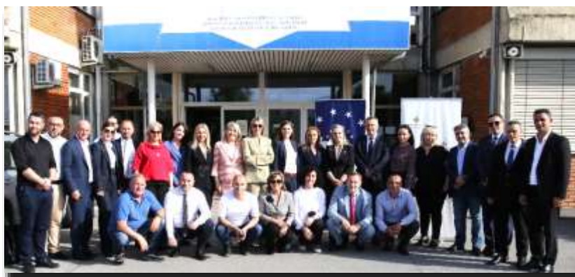
Komisioni për Rekrutim dhe stafi mbështetës pas përfundimit të Testit Kualifikues

Asnjë kandidat nuk ishte përjashtuar për shkak të mosrespektimit të rregullave dhe asnjë prej tyre nuk e ka kundërshtuar administrimin e provimit.