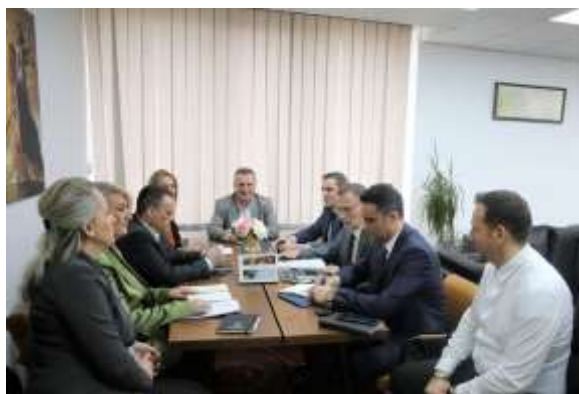
Takimi i parë i Komisioni për Rekrutim-Përzgjedhja preliminare

Nga katërqindënjëzetetë (428) aplikues, këtë fazë nuk arritën ta kalojnë vetëm njëzetë (20) aplikues.