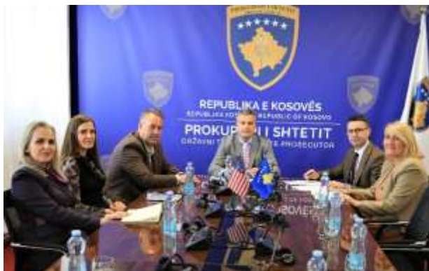
Takimi i parë i Komisionit për Rishqyrtim të ankesave ndaj përzgjedhjes preliminare

Pas përfundimit të fazës së ankesave, Komisioni për Rekrutim publikoi listën finale sipas së cilës, Testit Kualifikues do t'i nënshtroheshin katërqindënjëzetedy (422) kandidatë.